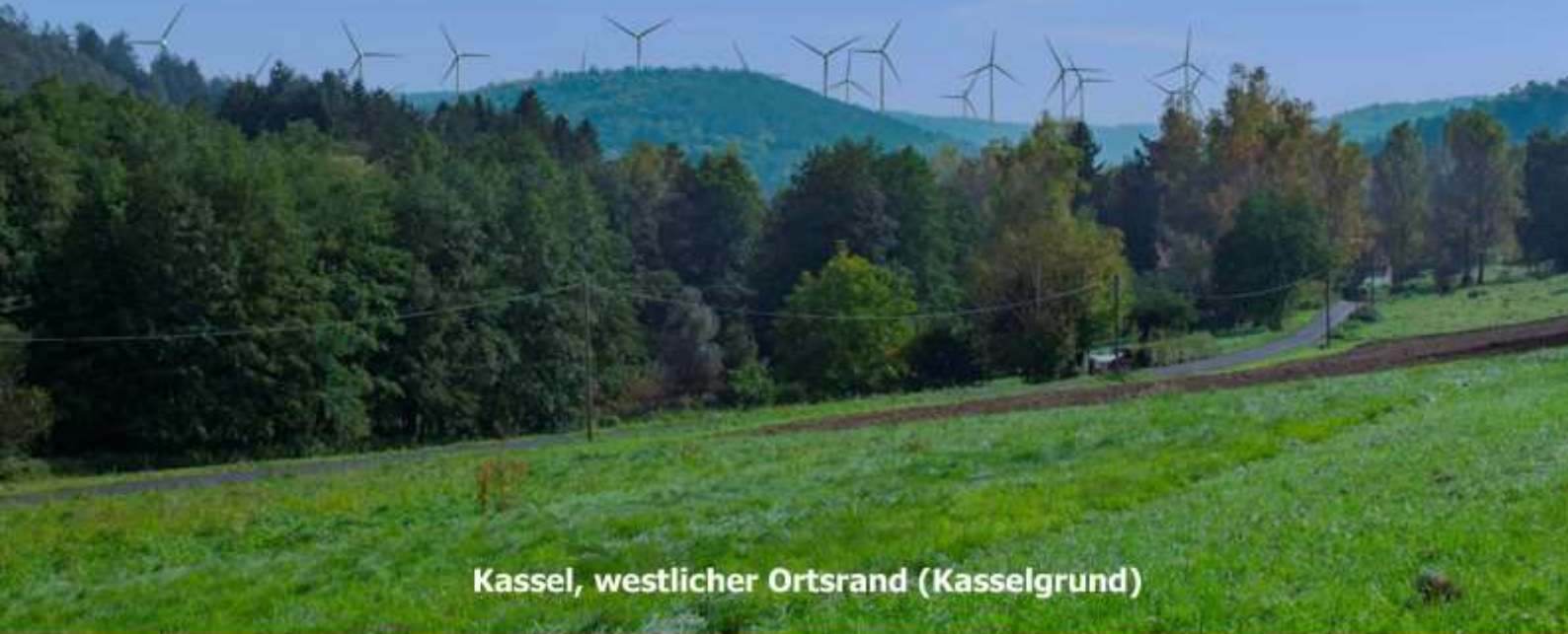
Kassel, westlicher Ortsrand (Kasselgrund)

Wertverlust der Immobilien + Lärm + Schattenwurf + Infraschall