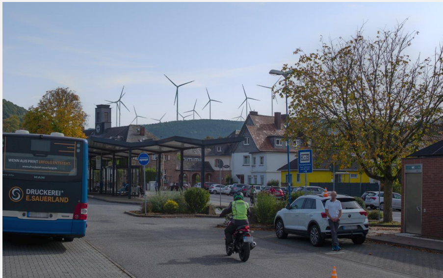
Bad Orb, Busbahnhof

Wir, die Unterzeichner, fordern den Verzicht auf die Bebauung des Horstberg bei Bad Orb, Biebergemünd, Jossgrund und bitten die Mitglieder der Hessischen Landesregierung und des Hessischen Landtages auf HessenForst und Ørsted einzuwirken, dieses Projekt nicht zu realisieren. Lt. Koalitionsvertrag beteiligen CDU und SPD die Kommunen an den Entscheidungen, ob Windkraftanlagen in deren unmittelbaren Umgebung gebaut werden.